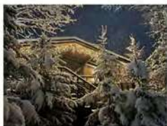
Гостевой дом "Вапити" на 4-7 гостей

Вас также могут заинтересовать наши другие домики