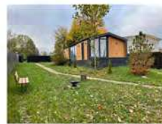
Гостевой дом "Муус" на 2-4 гостей

Подробнее о наших домиках вы можете узнать на нашем сайте или спросить у нас