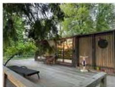
Гостевой дом "Хирви" на 2-4 гостя