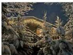
Гостевой дом "Вапити" на 4-7 гостей

Вас также могут заинтересовать наши другие домики