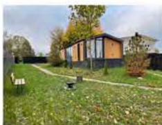
Гостевой дом "Муус" на 2-4 гостя