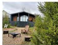
Гостевой дом "Эльк" с сауной на 4-7 гостей